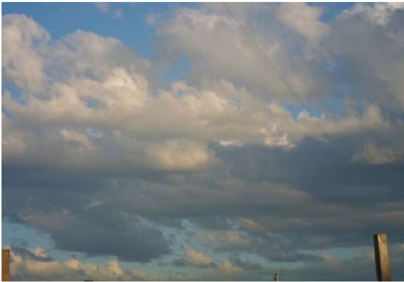
Foto N° 13. El cielo desde la ex-cancha de fútbol en Villa Elvira.

En este juego de solidaridades y carencias recíprocas, durante el visionado de las fotografías de Laura nos detuvimos en una de ellas en particular, que a simple vista parecía que solo mostraba el cielo que podía observar desde su cuadra por la tarde.